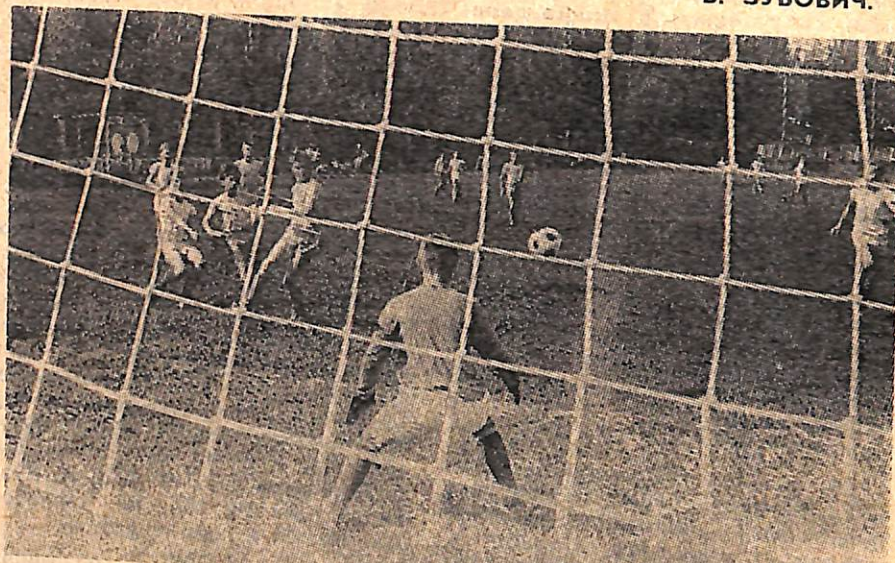
«Эй, вратарь, готовься к бою!»